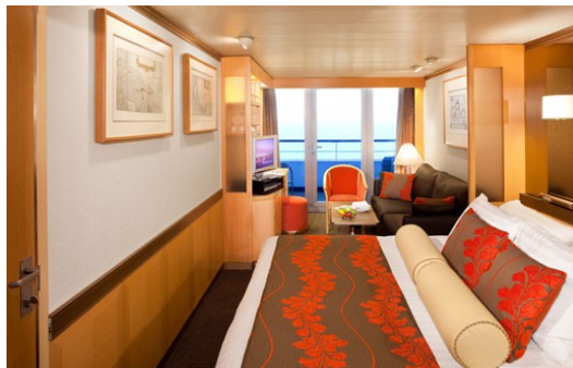
Buitenhut balkon suite